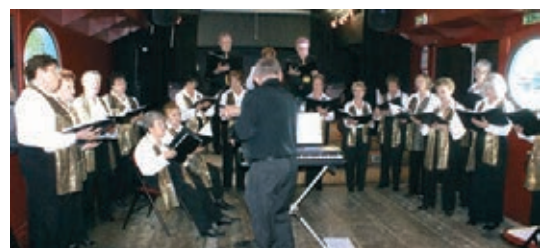
La Chorale d'Or a participé à la Fête de la musique en juin, sur la péniche.