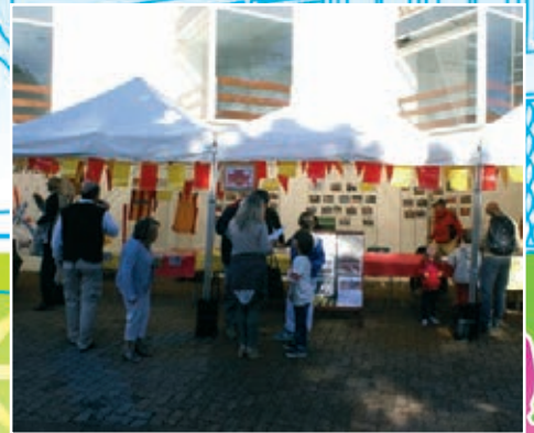
Stade de l'Est Pavillonnais