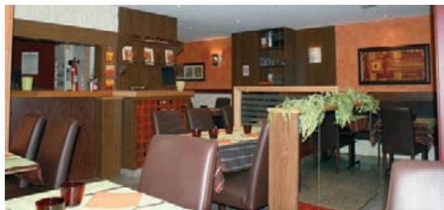
Le Jazz Bilig 20 Boulevard Roy - Tél. : 01 48 48 03 29