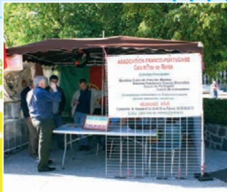
Casa de Tras-os-Montes