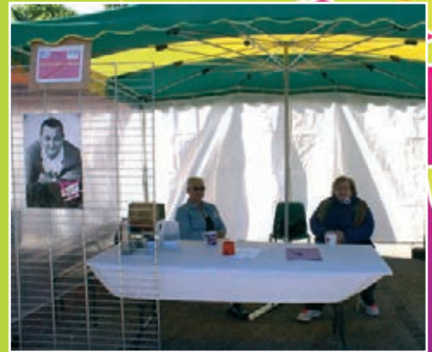
Restos du cœur