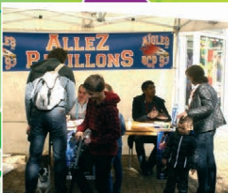
Badminton Club Pavillonnais