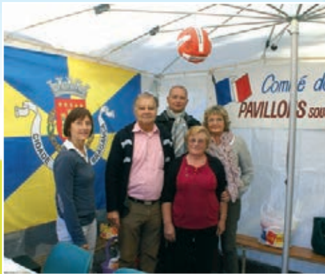
Jumelage Les Pavillons-sous-Bois - Bragançe