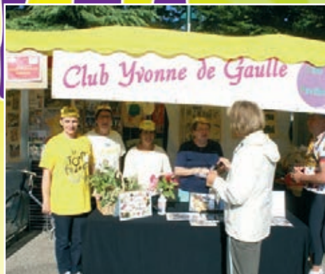
Club Yonne de Gaulle