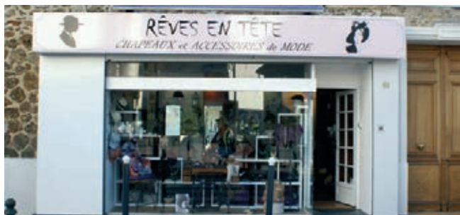
Rêves en Tête 65, allée Emile-Zola - Tél. : 09 53 76 76 60