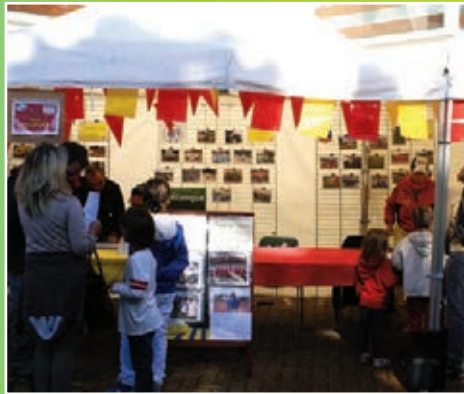
Stade de l'Est Pavillonnais