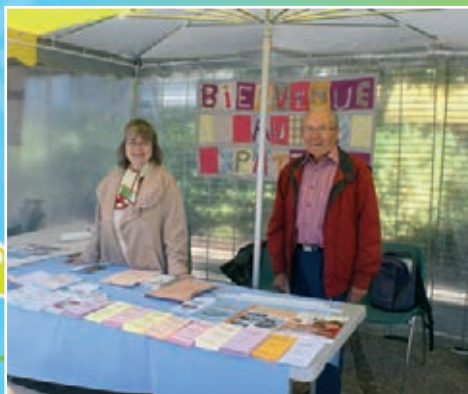
Association Alzheimer-Le Patio