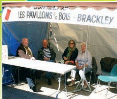
Jumelage Les Pavillons-sous-Bois - Brackley