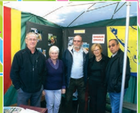
Jumelage Ecija - Les Pavillons-sous-Bois