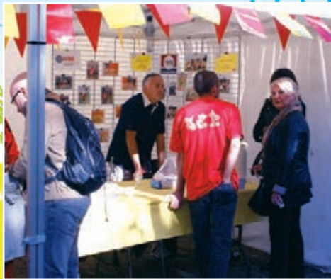
Stade de l'Est Pavillonnais