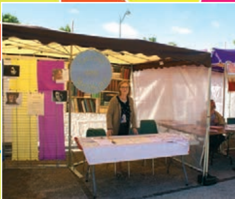
Cercle des lecteurs