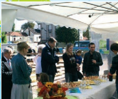
Accueil des nouveaux arrivants