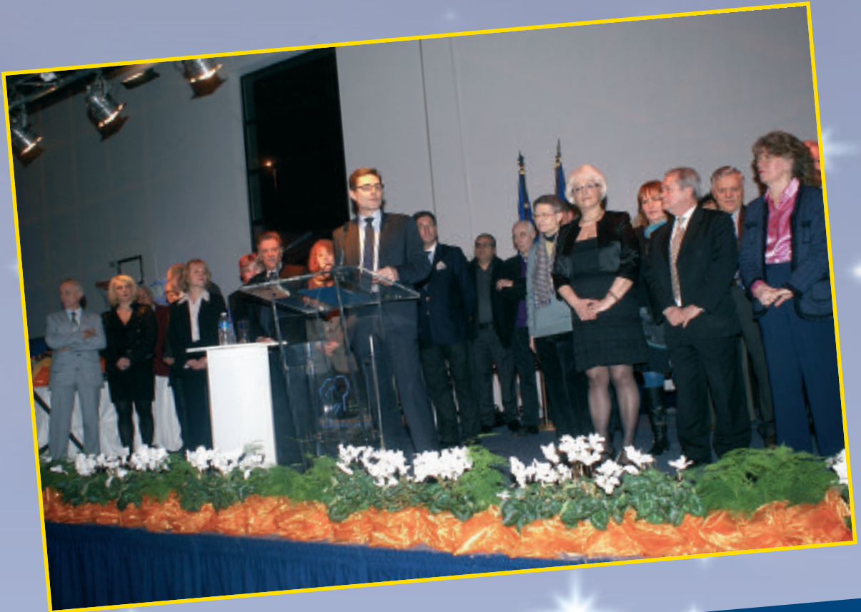
1 ère Adjointe au Maire