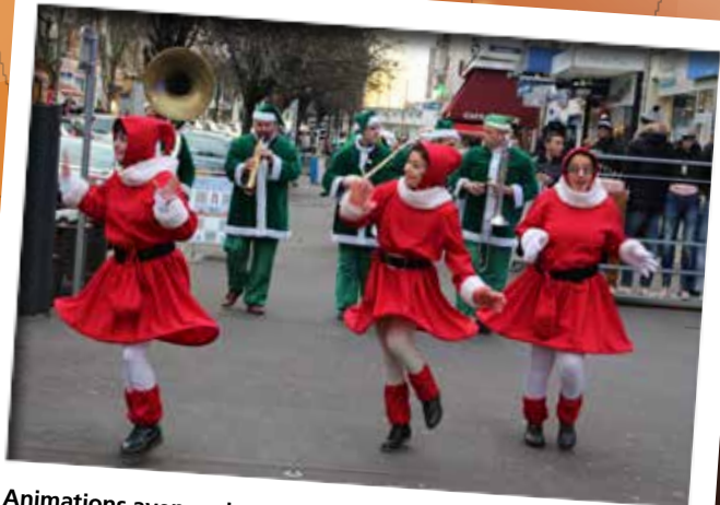
Animations avenue de Chanzy