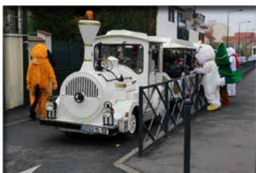
Pendant 3 jours, le petit train de Noël a circulé dans la Ville.