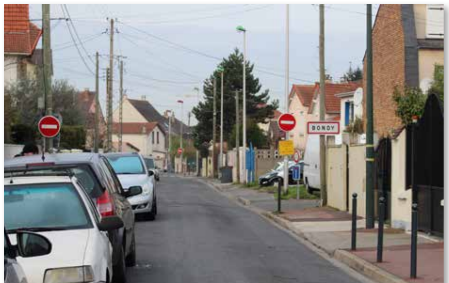
Bondy : le sens interdit contraint les automobilistes à faire demi-tour.

mécontentement et de sa volonté d'attaquer au Tribunal Administratif cette décision afin qu'elle puisse être annulée.