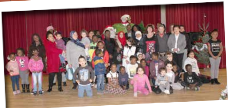
Noël du CCAS