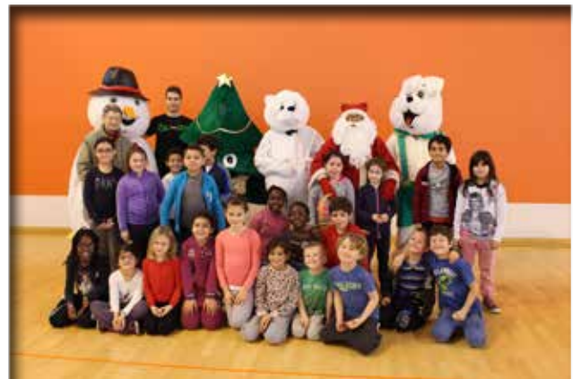
Visite au Stade Léo Lagrange