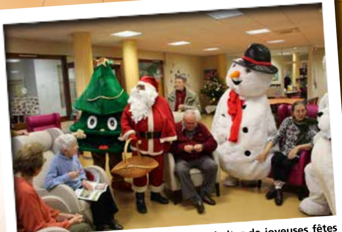
Les peluches géantes sont venues souhaiter de joyeuses fêtes dans les structures Seniors.