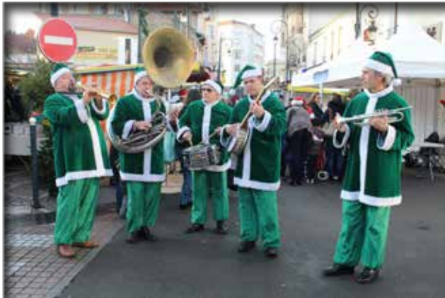
Animations musicales sur les marchés

La période des fêtes est l'occasion pour la Ville d'organiser des festivités pour célébrer les fêtes de fin d'année. Retour en images sur quelques manifestations.