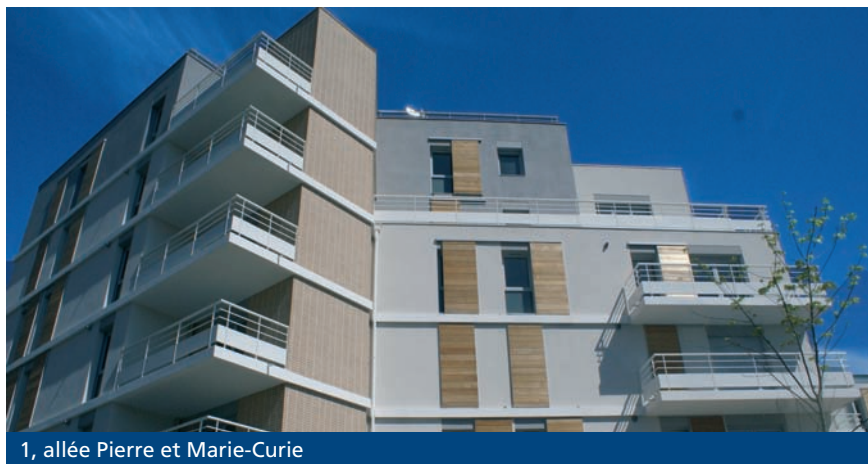
1, allée Pierre et Marie-Curie