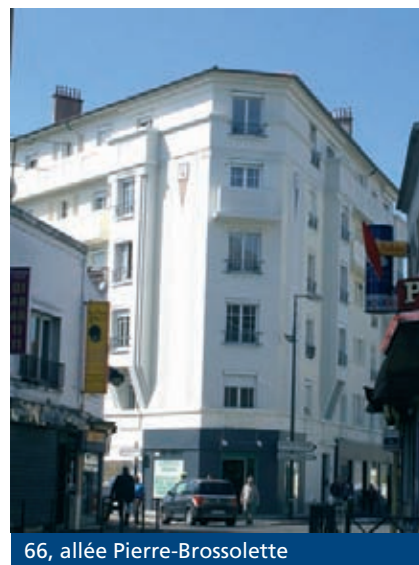
66, allée Pierre-Brossolette

de la façade a été réalisé en intégrant une isolation thermique. Tous les logements ont été entièrement rénovés (menuiseries PVC, portes palières, ballons d'eau chaude, aménagements cuisines et salles de bains, parties communes).