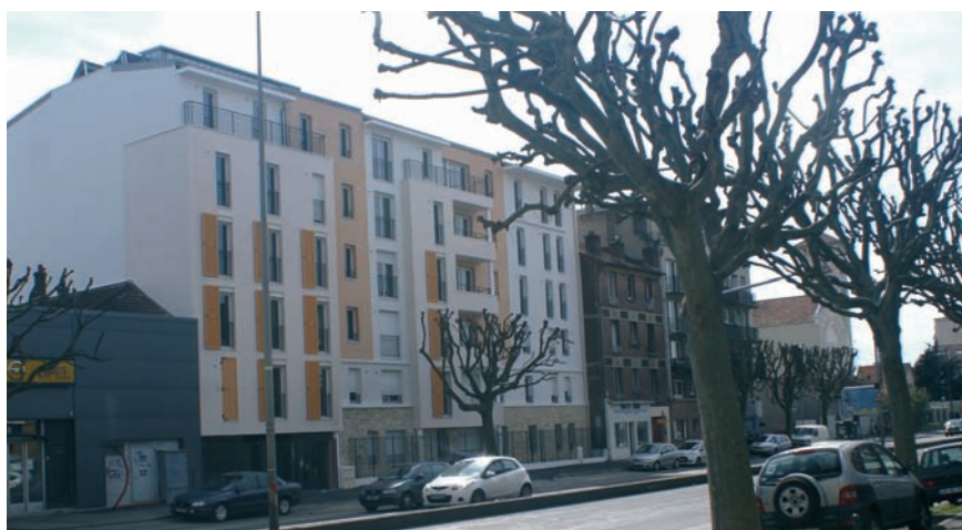
146-152 avenue Aristide-Briand

Au total 80 logements sociaux ont été construits par France Habitation : 20, situés au 1, allée Pierre et Marie-Curie, et 60, au 146-152 avenue Aristide-Briand. Les premiers emménagements se sont déroulés mi-avril et se poursuivront pendant plusieurs mois.